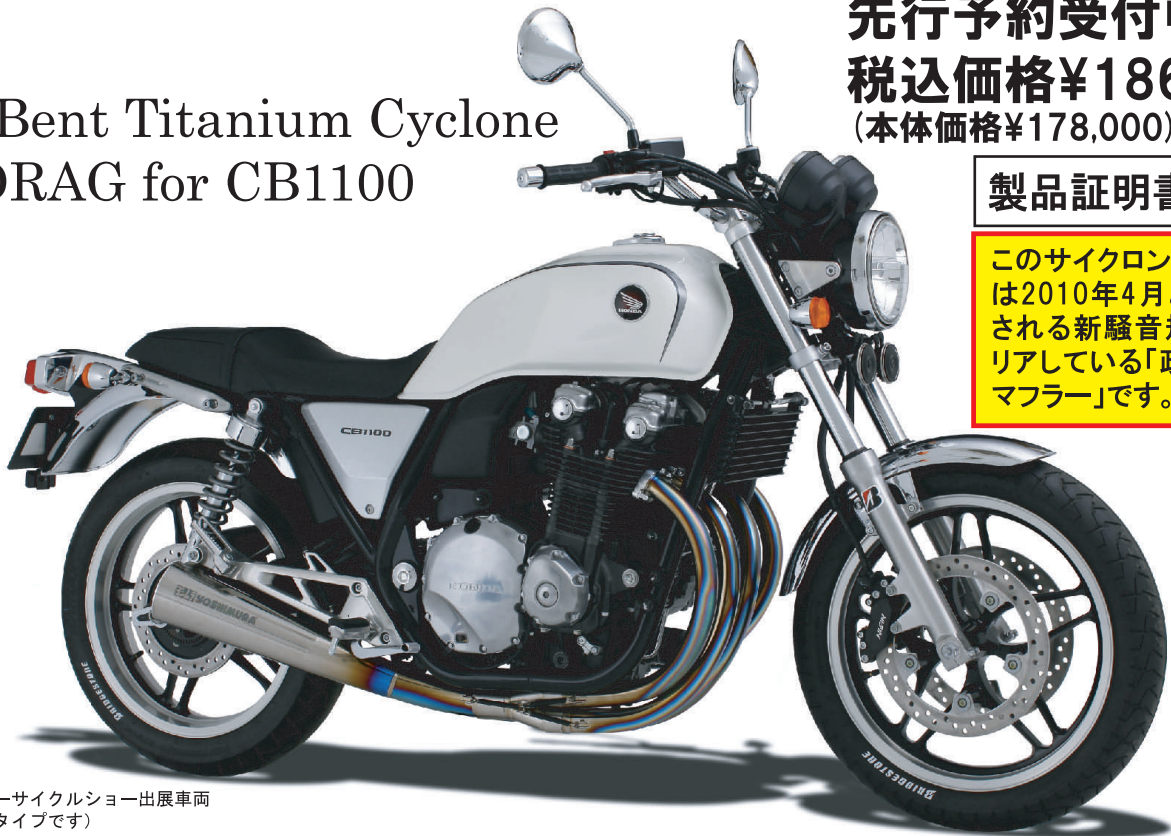
2010東京モーターサイクルショー出展車両 (写真はプロトタイプです)

このサイクロンマフラーは2010年4月より施行される新騒音規制をクリアしている「政府認証マフラー」です。