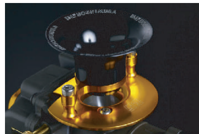
デュアルスタックファンネル