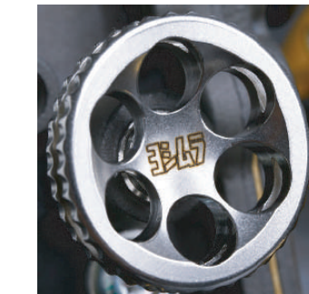
アイドルアジャストスクリュー