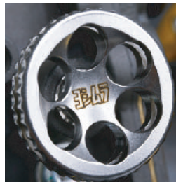
アイドルアジャストスクリュー