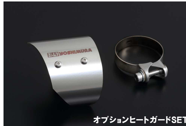
オプションヒートガードSET