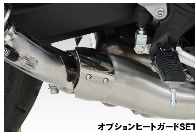
オプションヒートガードSET