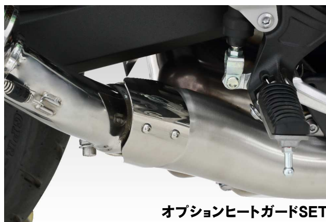
オプションヒートガードSET