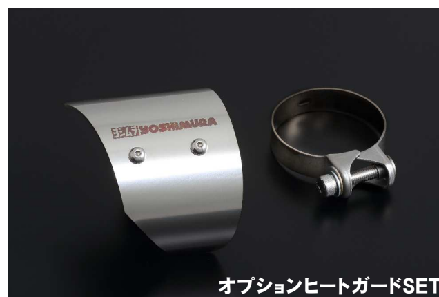
オプションヒートガードSET