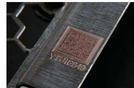
シリアル番号イメージ