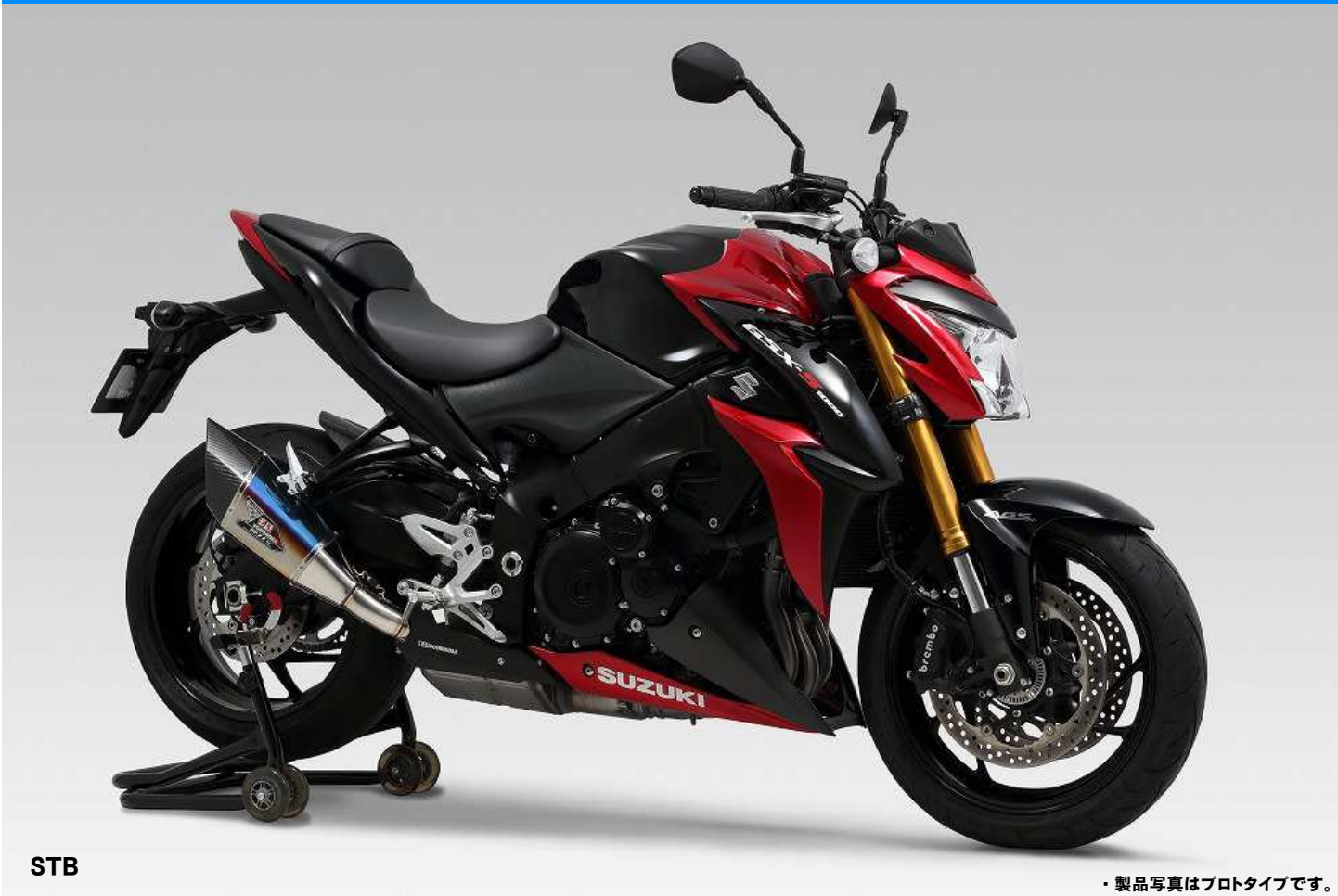
STB ・製品写真はプロタイプです。

GSX-S1000/F (15-17) Slip-On R-11Sqサイクロン EXPORT SPEC 政府認証 (ヒートガード付属)