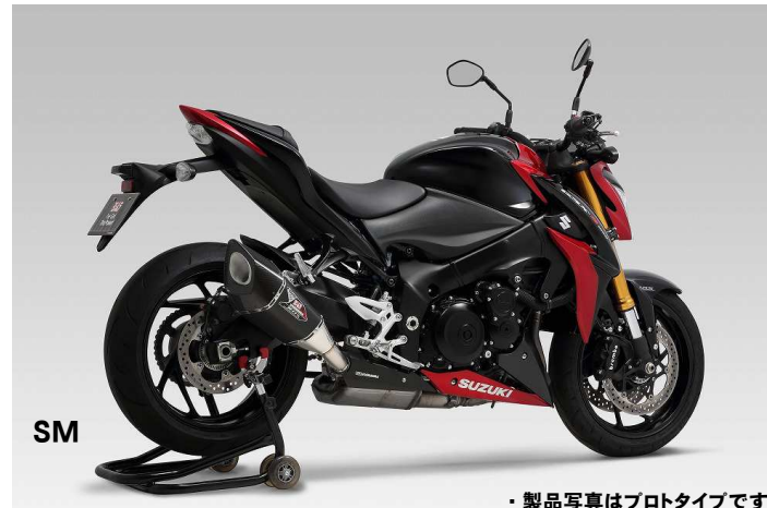
SM ・製品写真はプロタイプです。

ヨシムラサイクロン(レーシングサイクロンは除く)には、製品2年保証がついております。さらにリメイクサービス、マフラーホットライン等のアフターサービスにより、安心してヨシムラサイクロンをご利用いただけます。