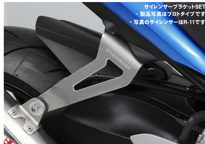
サイレンサーブラケットSET ・製品写真はプロタイプです。 ・写真のサイレンサーはR-11です。