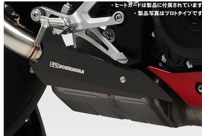
・ヒートガードは製品に付属されています。 ・製品写真はプロタイプです。