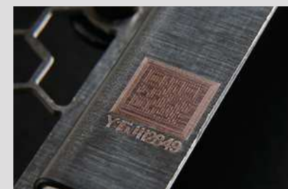
シリアル番号のイメージ