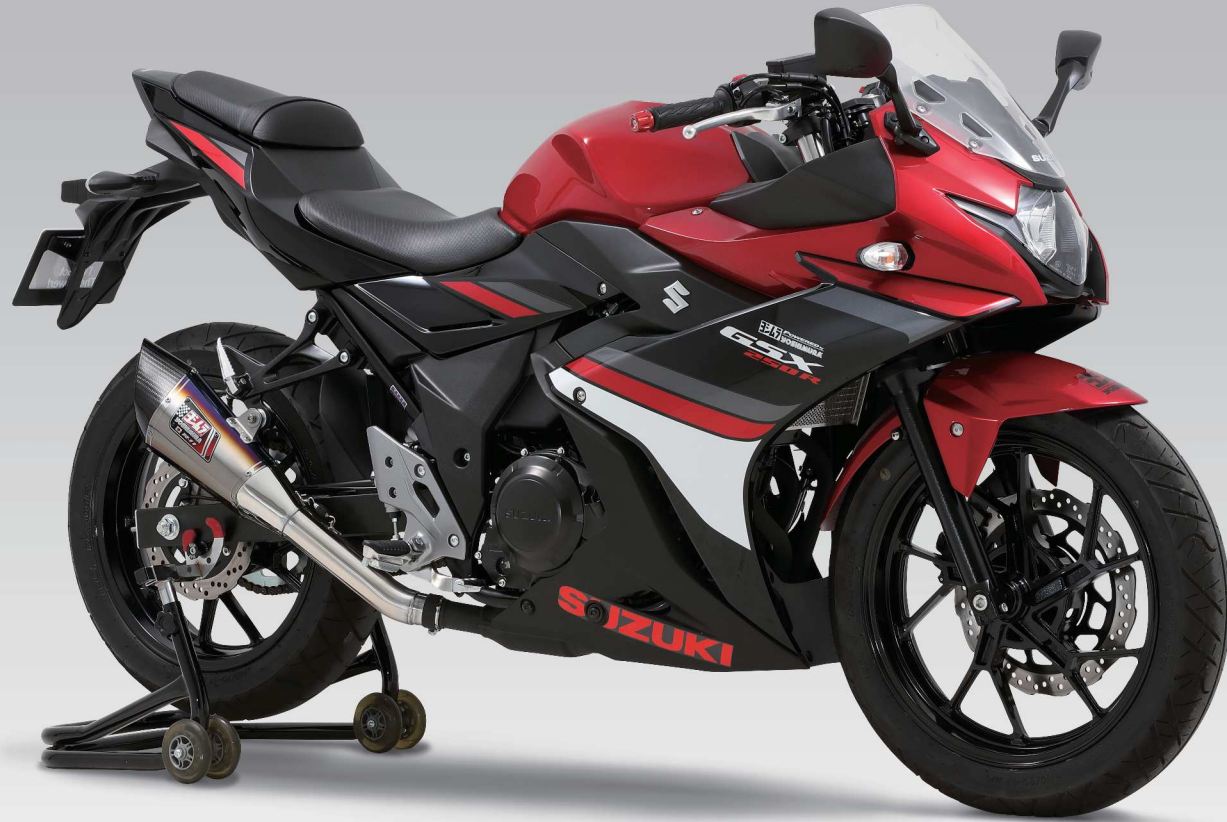
STB ・製品写真はプロトタイプです。

日常からロングツーリングまで、力強い相棒となる「GSX250R Slip-On R-11サイクロン」。