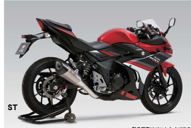
ST ・製品写真はプロトタイプです。