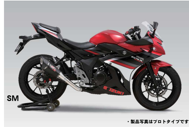
SM ・製品写真はプロトタイプです。

ツーリングの相棒に選びたいGSX250R。マフラーサウンドはライダーにストレスを与え疲労の原因となる事もあるので、ヨシムラサイクロンは高速道路走行のように中・高回転をキープし長距離走行をするロングツーリングも想定して開発。心地良さとのバランスを考慮したマフラーサウンドを作り出しています。サイズがコンパクトでレーシーなスタイルのR-11サイクロンは、R-77Sサイクロンに比べると高音が効いたサウンドが特徴です。