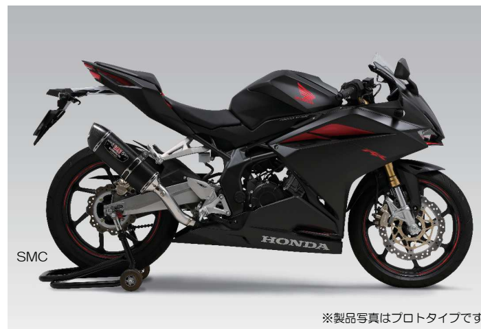
SMC ※製品写真はプロトタイプです。

このEXPORT SPECは、海外の拘ったユーザーのリクエストを反映する事により、性能を重視しつつ職人的な溶接(Tig)の焼け色や加工跡はオリジナルのまま仕上げています。素材に高耐久ステンレスを使用することによりヨシムラ独自のデザイン・スタイルを実現させながらもコストパフォーマンスにも優れています。