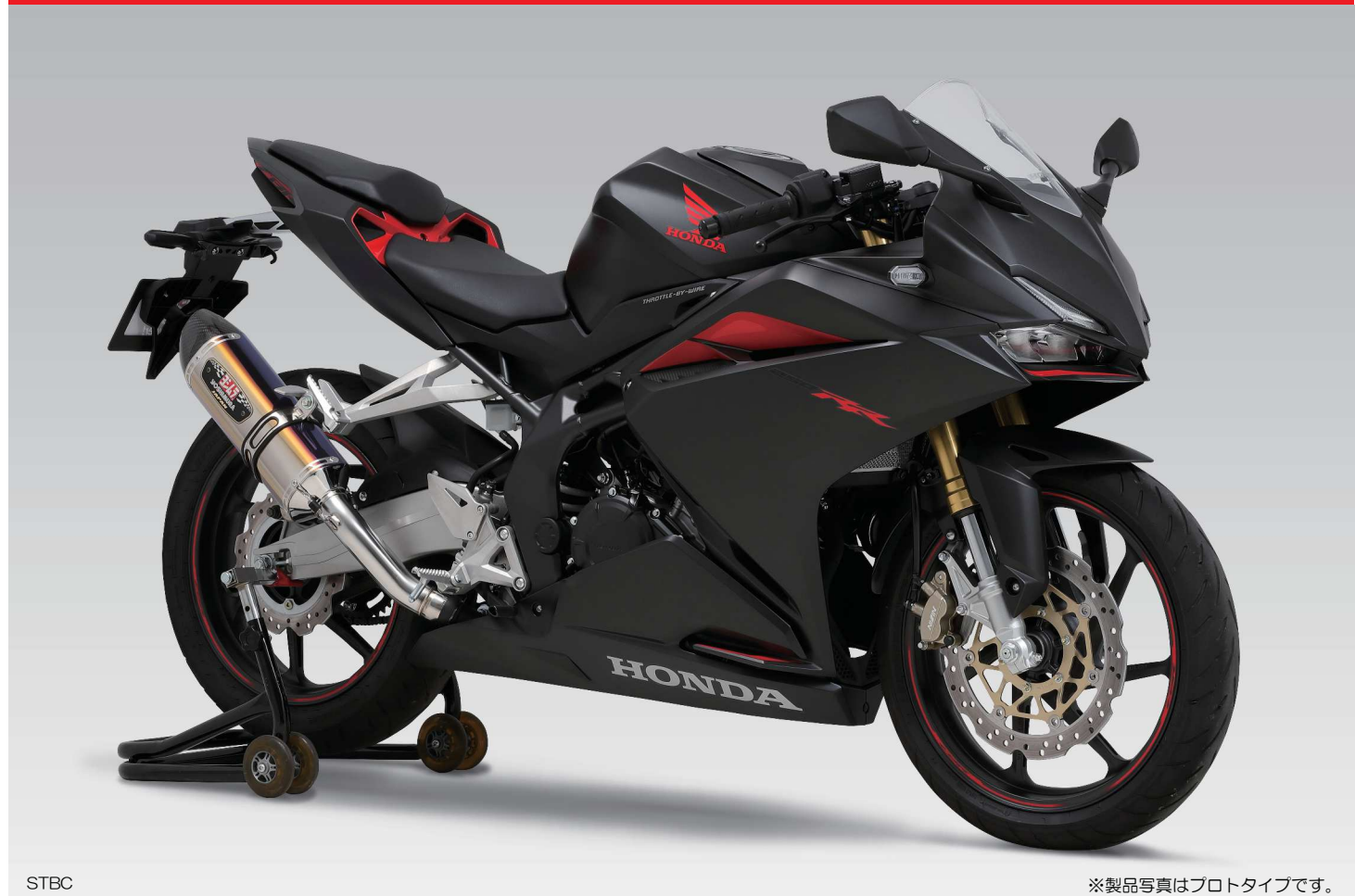
STBC ※製品写真はプロトタイプです。

HONDA CBR250RR (17) 国内仕様 Slip-On R-77S サイクロン カーボンエンド EXPORT SPEC 政府認証