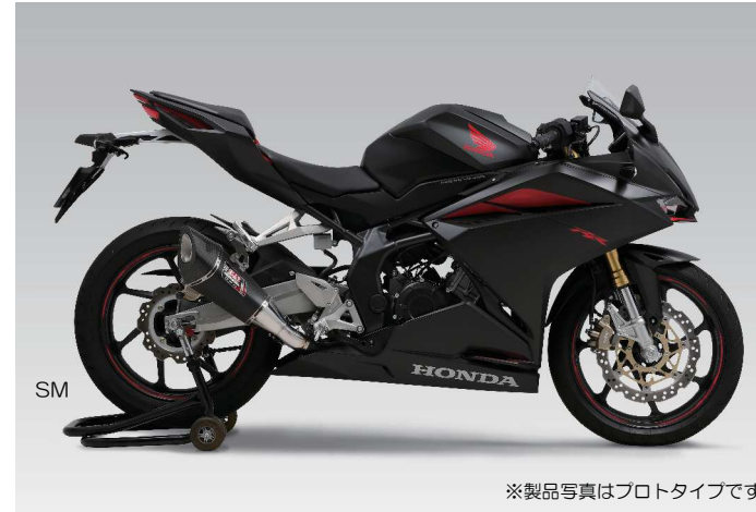
※製品写真はプロトタイプです。

このEXPORT SPECは、海外の拘ったユーザーのリクエストを反映する事により、性能を重視しつつ職人的な溶接(Tig)の焼け色や加工跡はオリジナルのまま仕上げています。素材に高耐久ステンレスを使用することによりヨシムラ独自のデザイン・スタイルを実現させながらもコストパフォーマンスにも優れています。