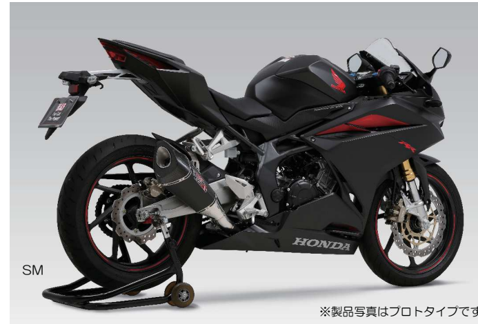
※製品写真はプロトタイプです。