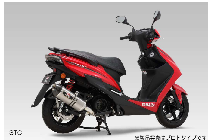
STC ※製品写真はプロトタイプです。