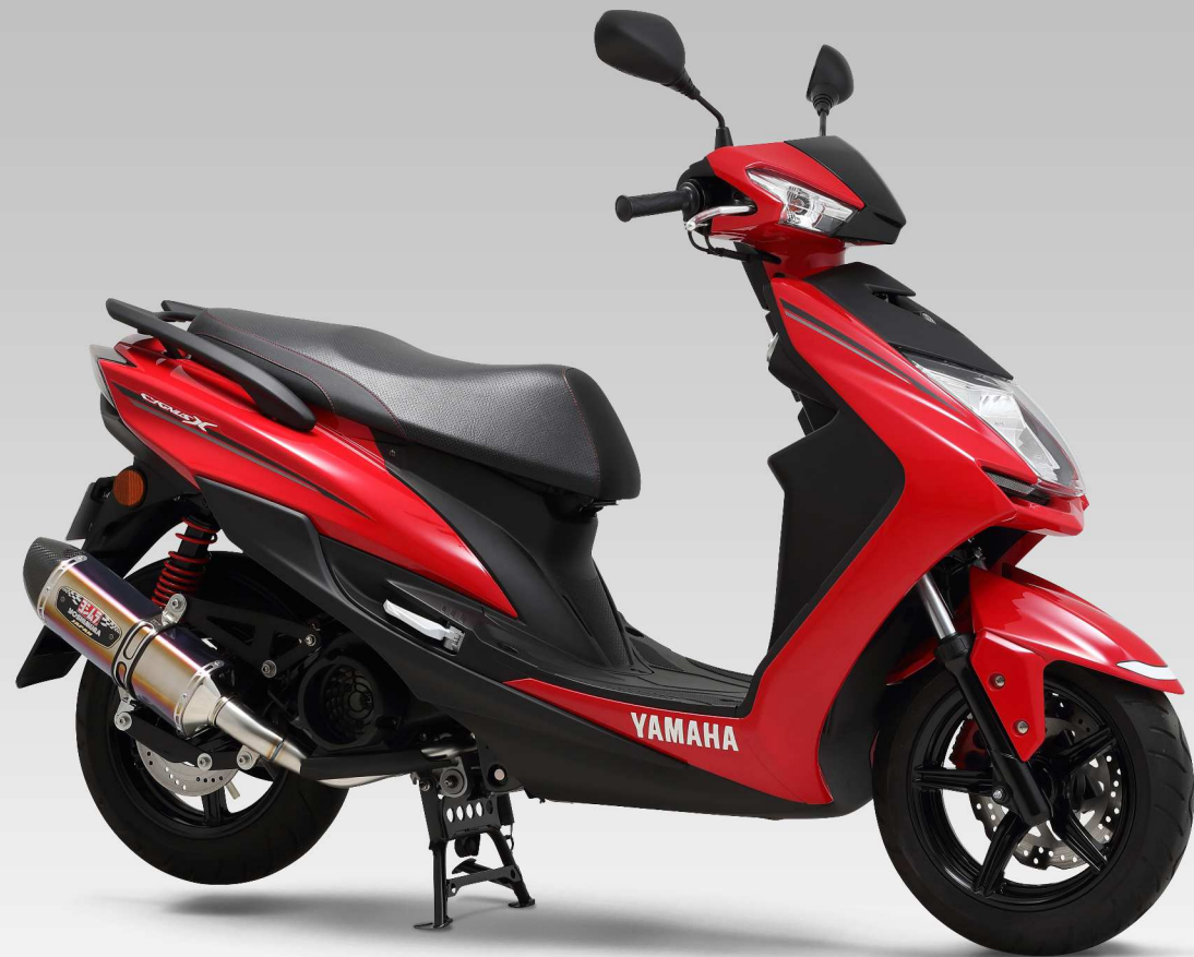
STBC ※製品写真はプロトタイプです。

YAMAHA シグナスX SR (16) 国内仕様 機械曲 R-77S サイクロンカーボンエンド EXPORT SPEC 政府認証