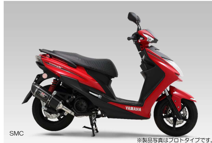
SMC ※製品写真はプロトタイプです。